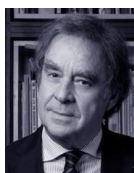
Jean-Michel Wilmotte Architecte Urbaniste Designer