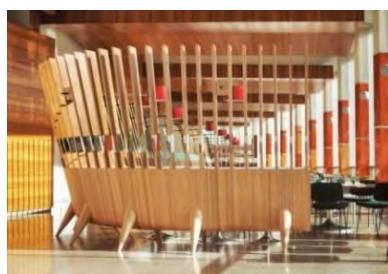
RADIOEAT & BEL AIR