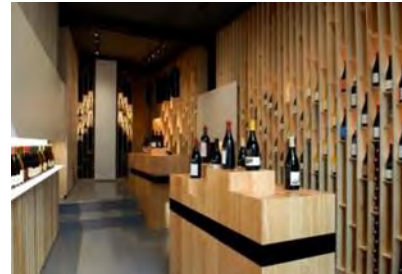
LA FAUTE AU VIN