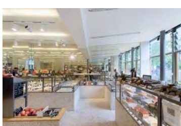
LA MAISON PLISSON