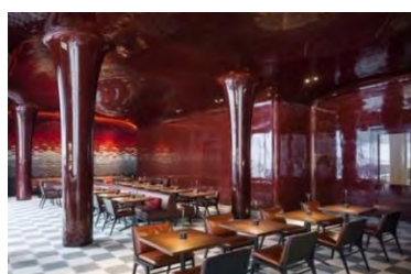
LES BAINS - LA SALLE A MANGER