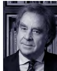
Jean-Michel Wilmotte Architecte Urbaniste Designer