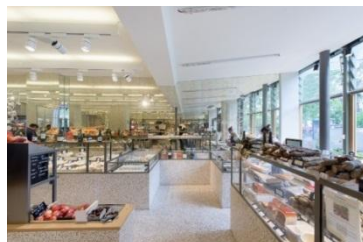
LA MAISON PLISSON