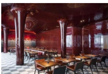
LES BAINS - LA SALLE A MANGER