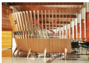
RADIOEAT & BEL AIR