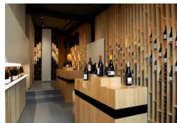
LA FAUTE AU VIN