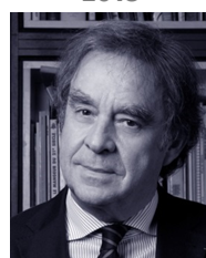
Jean-Michel Wilmotte Architecte Urbaniste Designer