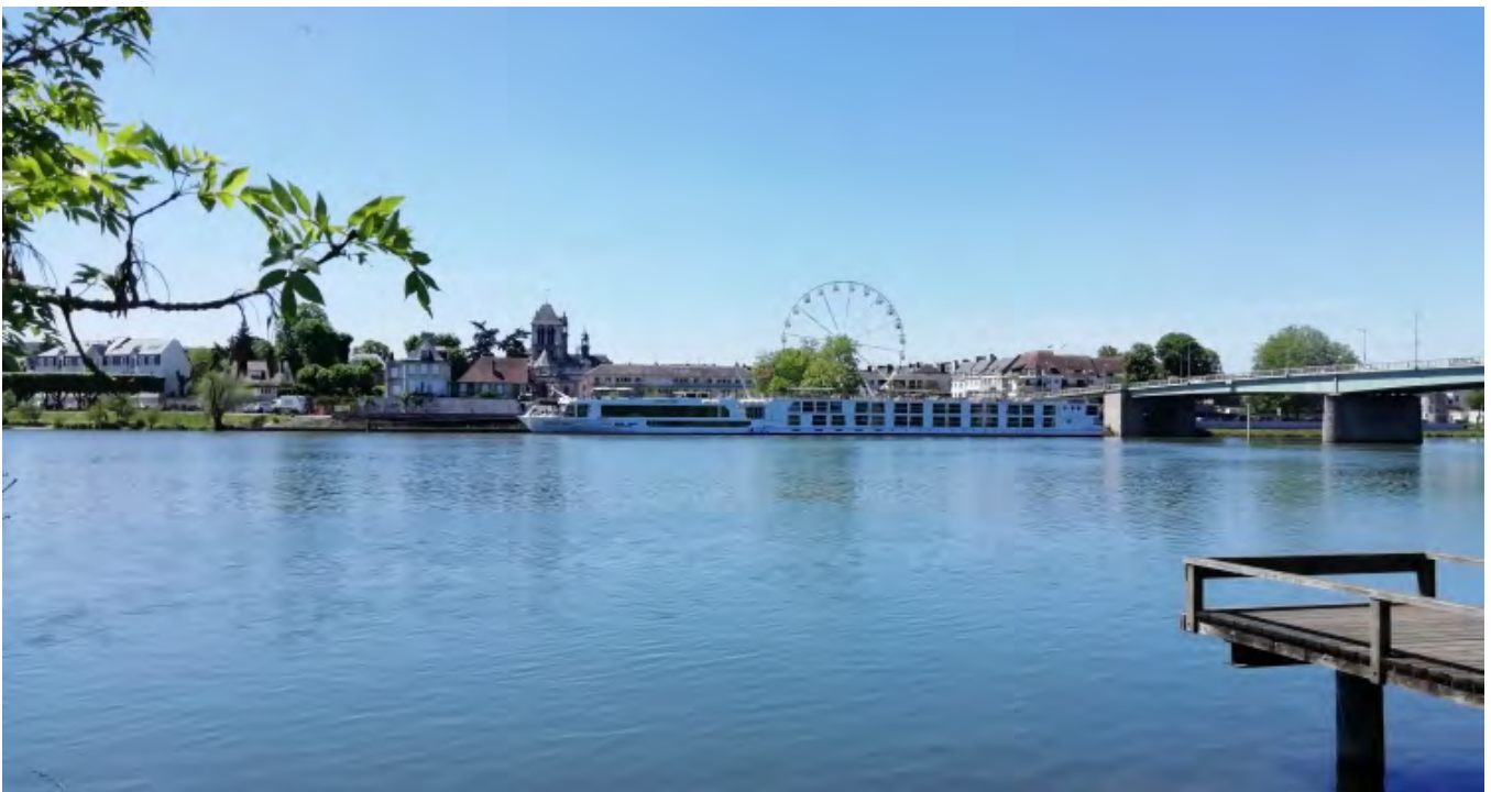
Tourisme fluvial : escale sur la Seine à Vernon

A l'initiative de l'ADAS (Association des Départements de l'Axe Seine) une matinée consacrée au tourisme fluvial sur l'Axe Seine a été organisée sur la commune de Giverny, dans l'Eure. Un lieu qui ne doit rien au hasard :