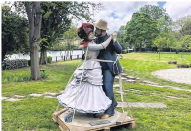
Le tableau de Renoir Danse à Bougival sculpté par Seward Johnson.

Les visiteurs peuvent ainsi découvrir deux toiles signées Renoir, avec Danse à Bougival et Les Deux sœurs et l'une de Manet, Dans la serre . Si Renoir n'a pas vécu à Bougival, on sait en revanche qu'il y a peint plusieurs de ses toiles, notamment depuis l'Île de la Chaussée quand l'artiste s'attardait au Bal des Canotiers